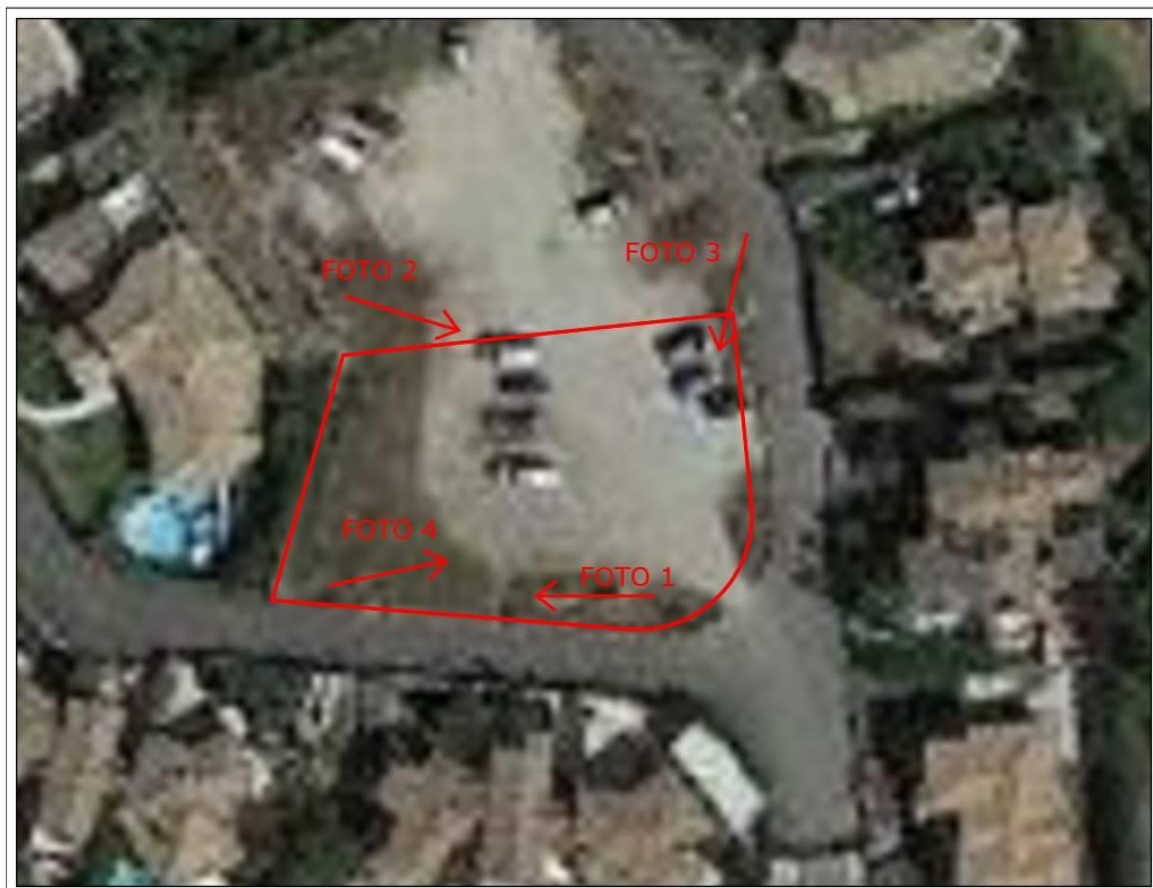
Vista Aerea con indicazione dei punti di presa fotografica